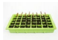
BANDEJAS, REJILLAS, CAPAZOS